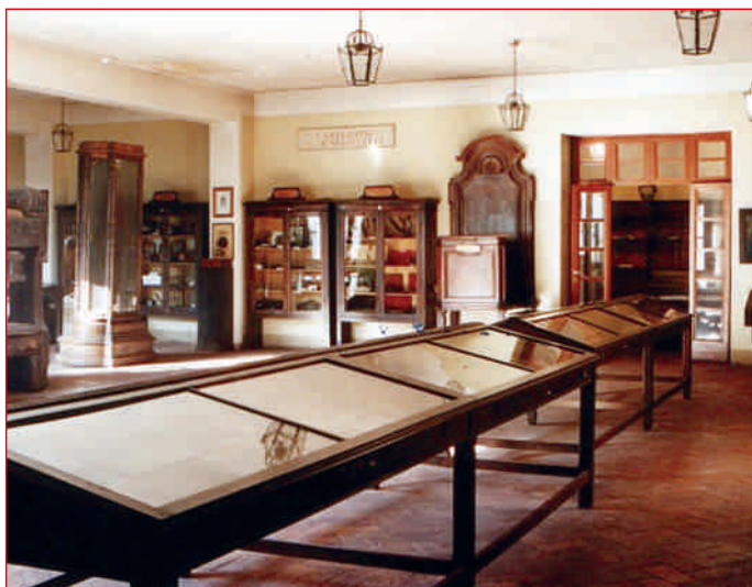
Sala Carbonelli (in fondo la cattedra del Lancisi)