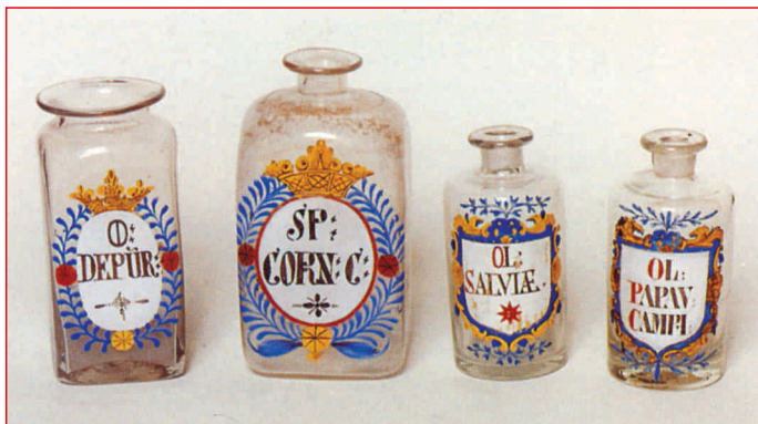
Vetri di farmacia nella Sala Capparoni